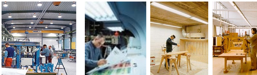
Horizontale taken in een bedrijfshal: lees- montage- en spuitwerkzaamheden.

Om de verlichtingsinstallatie in kaart te kunnen brengen, worden bedrijfshallen verdeeld in twee categorieën. Magazijn- en opslaghallen (met ruimtevlakken als transportwegen, stellingen, verzamelplekken, expeditie, kantoor, sanitaire groepen en technische ruimten) en bedrijfshallen waarin productieprocessen plaatsvinden. Dat zijn meestal hallen met machineopstellingen, chemische bergingen, materiaalopslag en eindproductopslag. In dergelijke hallen komen ook ruimtevlakken voor als loopgebieden, transportwegen, stellingen en expeditieruimten. De oogtaak in bedrijfshallen bestaat uit horizontaal werk (waarnemen, herkennen, lezen en schrijven) en verticaal werk (loop- en transportbewegingen, lezen van labels, herkennen van objecten en beeldschermwerk). Van mensen in bedrijfshallen wordt visueel veel gevraagd. Factoren zoals detail- en kleurherkenning, lezen van computerlijsten, rijden met heftrucks, communicatief vermogen en besluitvaardigheid zijn van groot belang. Er is veelal weinig contact met de buitenwereld. Alleen wanneer het kunstlicht alle hoge kwaliteitseisen voldoet, kunnen medewerkers hun taak goed aan.