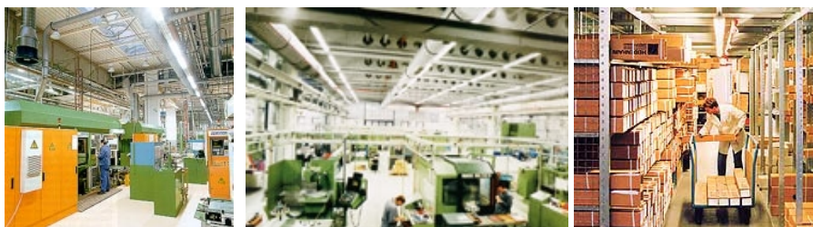
Verticale taken in een bedrijfshal: machinewerk, beeldschermwerk en werken tussen stellingen.